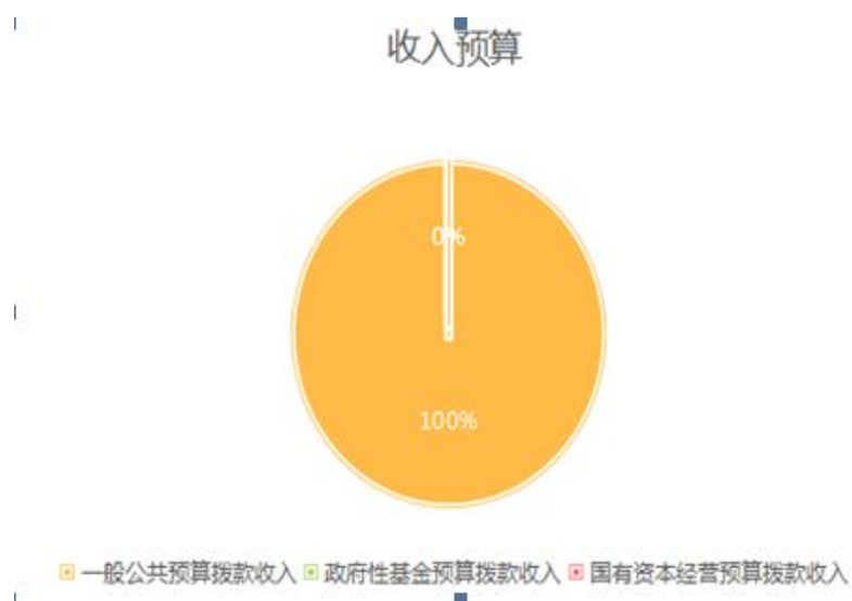
图 1: 收入预算