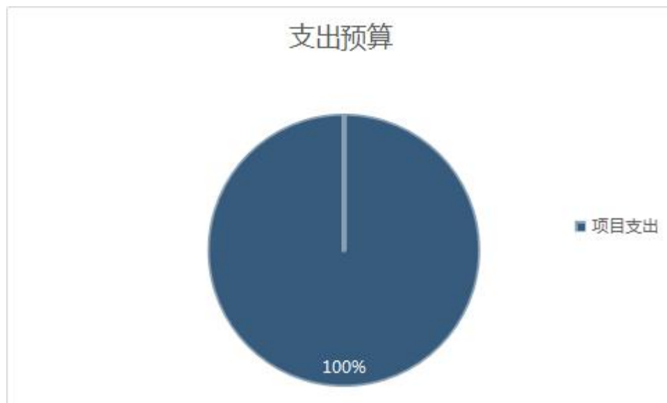
图 2：基本支出和项目支出情况