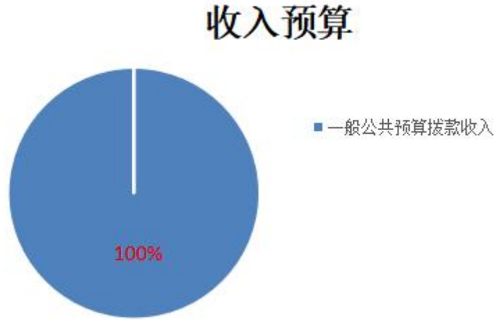
图 1: 收入预算