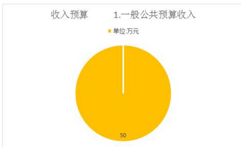
图 1: 收入预算