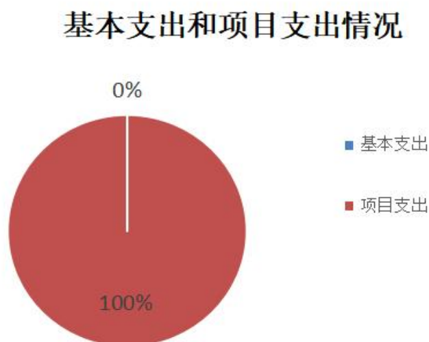
图 2：基本支出和项目支出情况