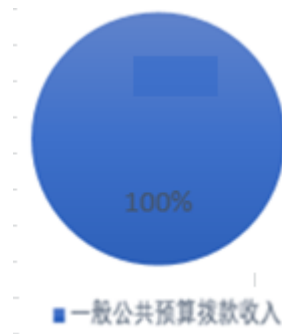
图 1: 收入预算